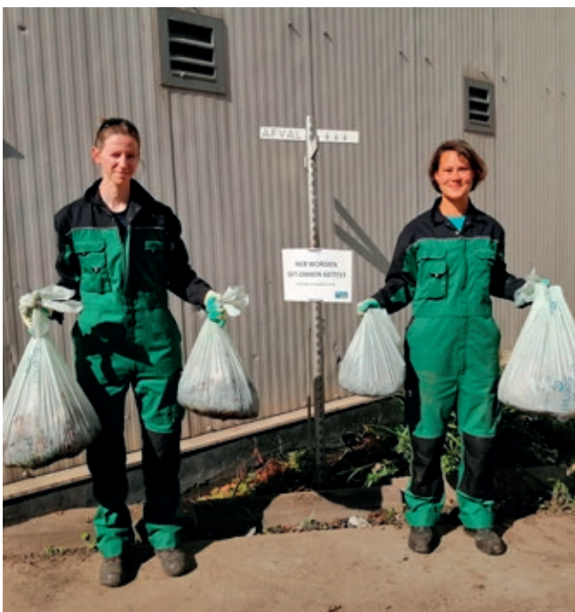
Na 4 weken waren de 4 zakken die op natte aarde stonden nog altijd in goede staat.

Hoe betrouwbaar is deze test? Kim: "De zakken hebben in de regen, felle zon en op natte aarde gestaan. In veel extremere situaties dus dan de leverancier voorschrijft. En toch hebben alle zakken het minimum 4 weken volgehouden."