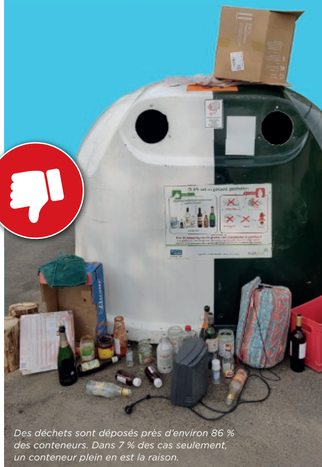
Des déchets sont déposés près d'environ 86 % des conteneurs. Dans 7 % des cas seulement, un conteneur plein en est la raison.